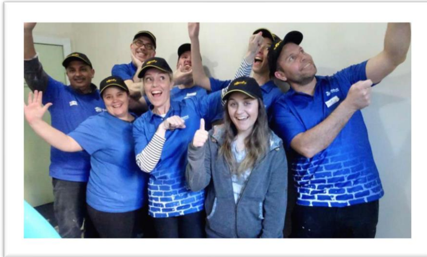
Chantier solidaire pour la rénovation des bâtiments le 25 juillet 2019