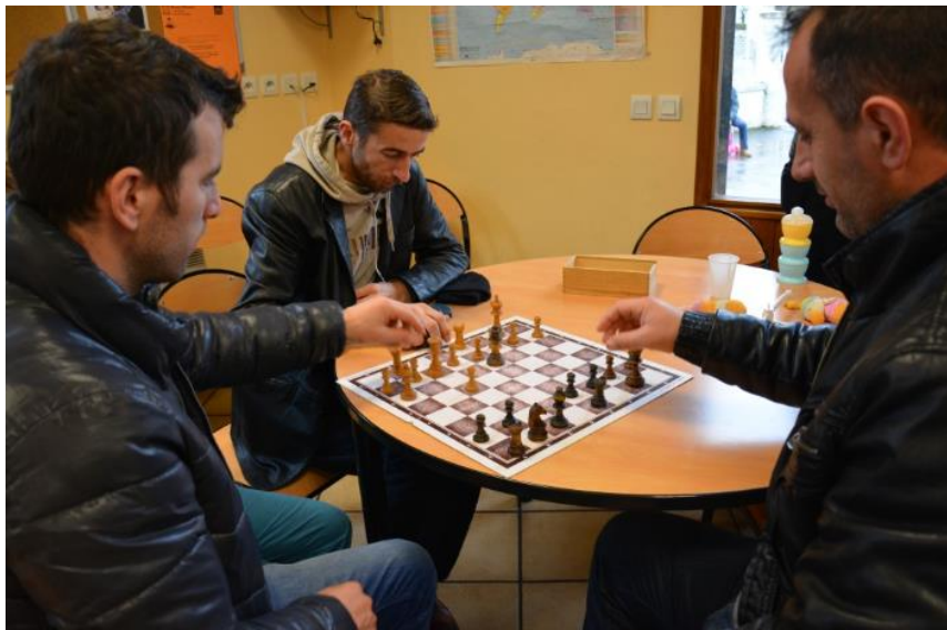
Des activités organisées par la Délégation du Secours Catholique de Haute-Savoie

L'habitat et le logement constituent un des leviers pour maintenir dans la société les personnes en situation d'exclusion. Pour assurer cette cohésion sociale, il est aujourd'hui nécessaire d'inventer de nouvelles façons d'habiter ensemble. La Fondation Somfy souhaite accompagner des projets favorisant les rencontres entre les catégories sociales et les générations. Elle soutient des expériences innovantes tournées vers le lien social, permettant de favoriser de nouvelles formes de diversité socioculturelle.