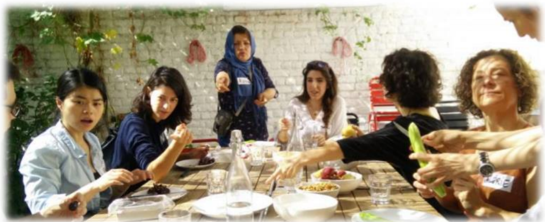
Repas partagé dans le cadre du programme CALM – Bruxelles - Belgique