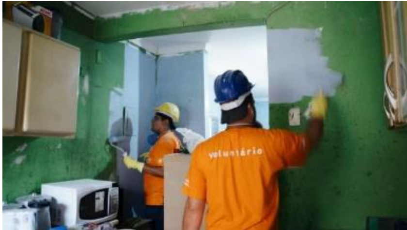
Rénovation de maisons dans la favela Héliopolis – Sao Paulo – Brésil