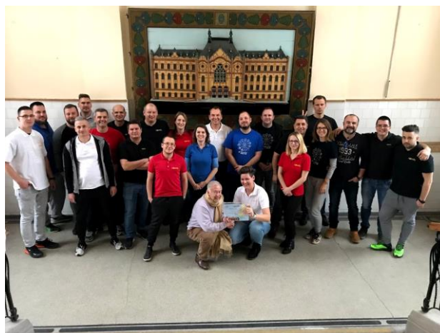
Chantier Solidaire du 12 décembre avec toute la BA – Budapest - Hongrie