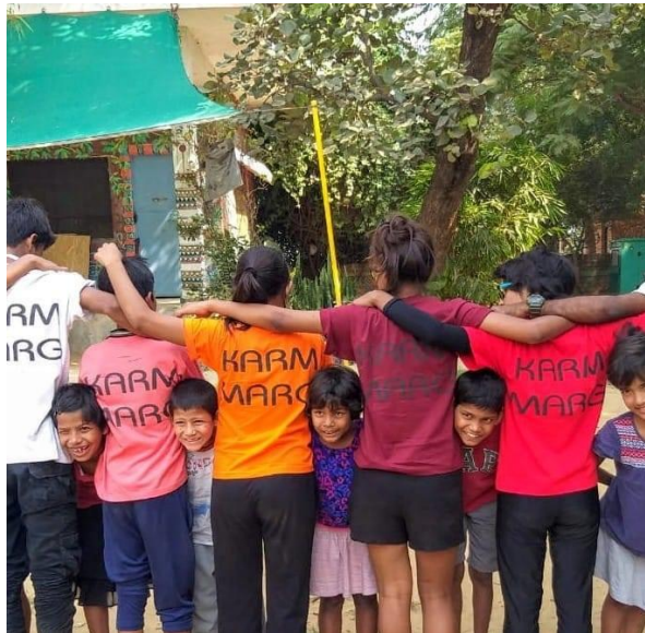
Enfants accueillis et hébergés par l'ONG Karm Marg – New Dehli - Inde