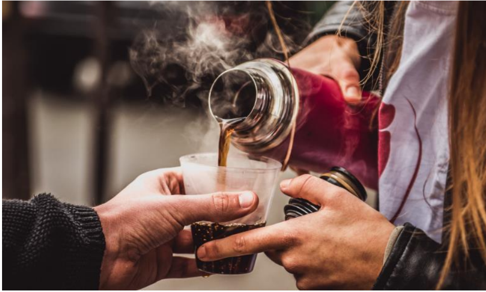
Maraude organisée par Une Couverture en Hiver sur Paris