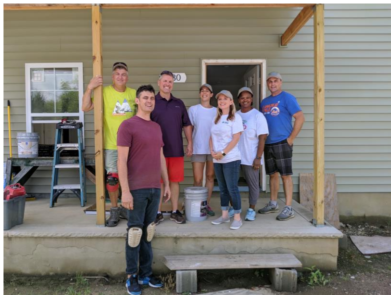
Chantier Solidaire avec l'équipe des USA le 25 juillet 2019