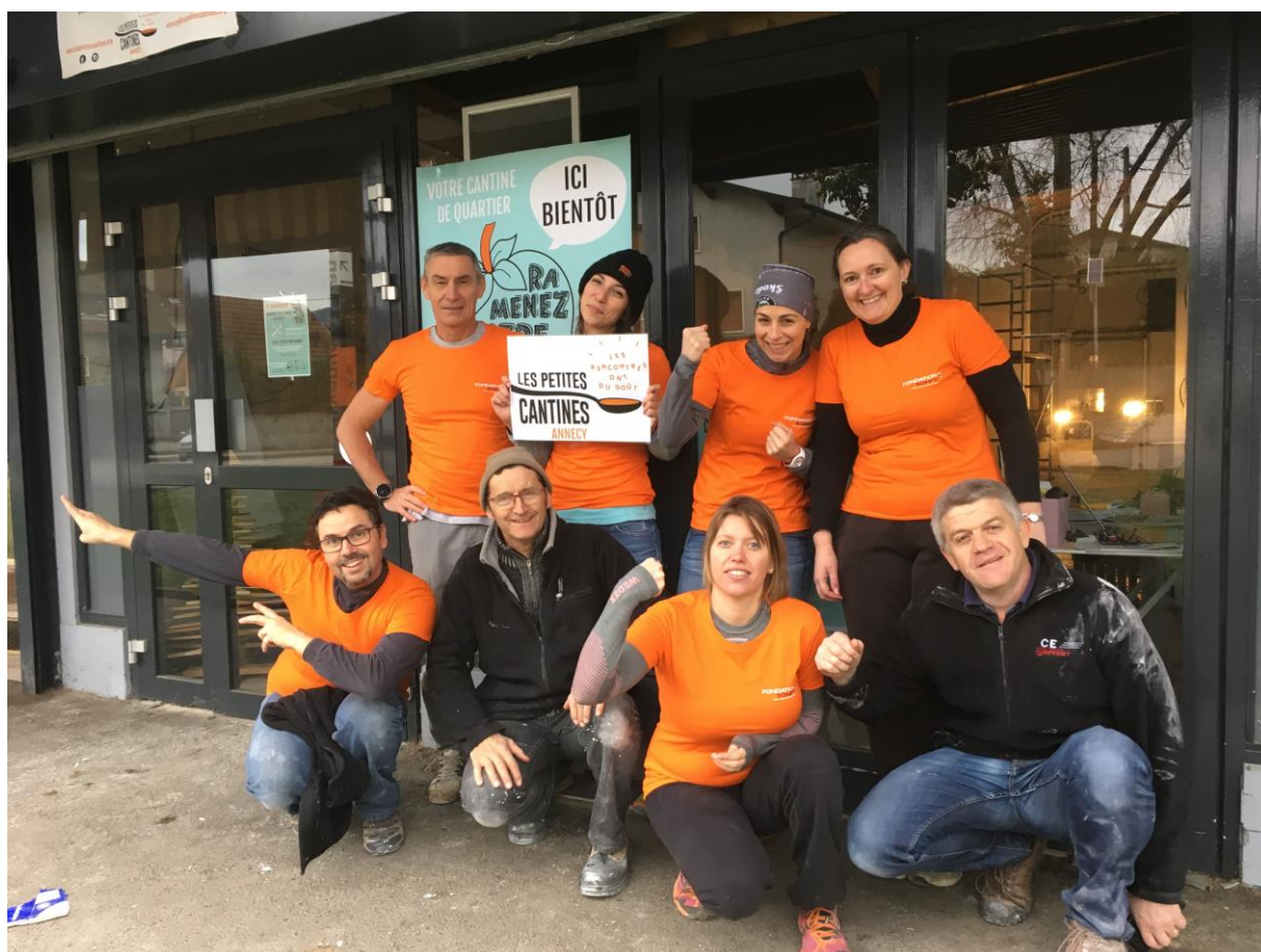
Equipe des Achats – Chantier Solidaire pour Les Petites Cantines – décembre 2019 - Cranves-Sales

Le nombre de salariés participant à ces Missions Solidaires est en constante augmentation depuis le lancement de ces actions en juillet 2012.